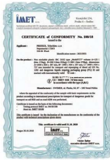
mobiFITT UN 規格適合証明書

平成2年2月16日付け消防危第18号消防庁危険物規制課長による通知4UN表示に関する事項(2)において、『UN表示が付された運搬容器にあっては、告示に定めるそれぞれの試験と同等の試験に適合するものである』と判断して差し支えないものであることとされています。